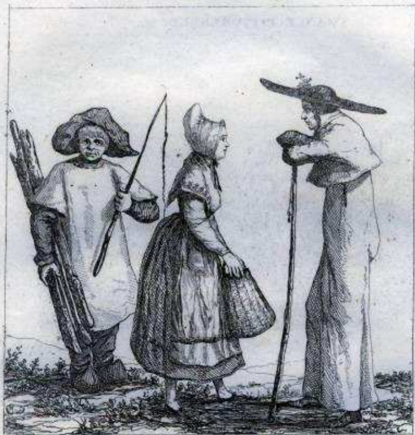
Costumes du Tarn